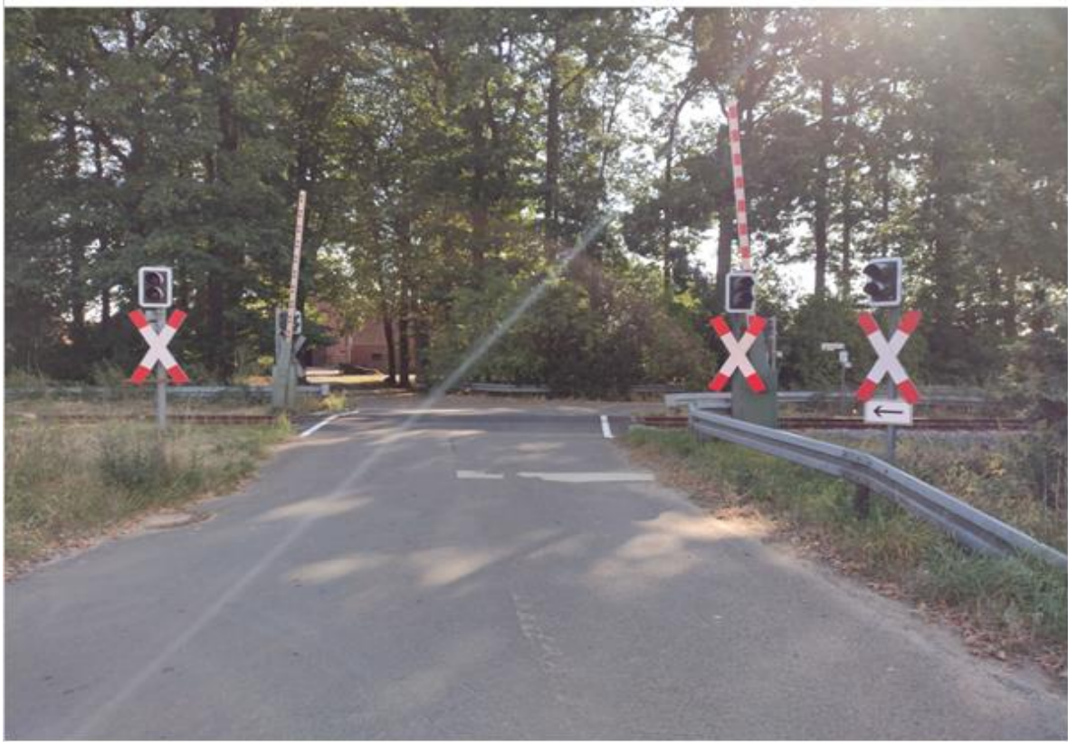
Abbildung 1: BÜ km 69,772 „Im Lienesch“, Strecke 1502, Gemeinde Badbergen Blick in Richtung Osten

Im Auftrag der DB Netz AG wurde eine Verkehrszählung am Bahnübergang km 69,772 „Im Lienesch“ in der Gemeinde Badbergen, auf der Strecke 1502 (Oldenburg - Osnabrück) durchgeführt.