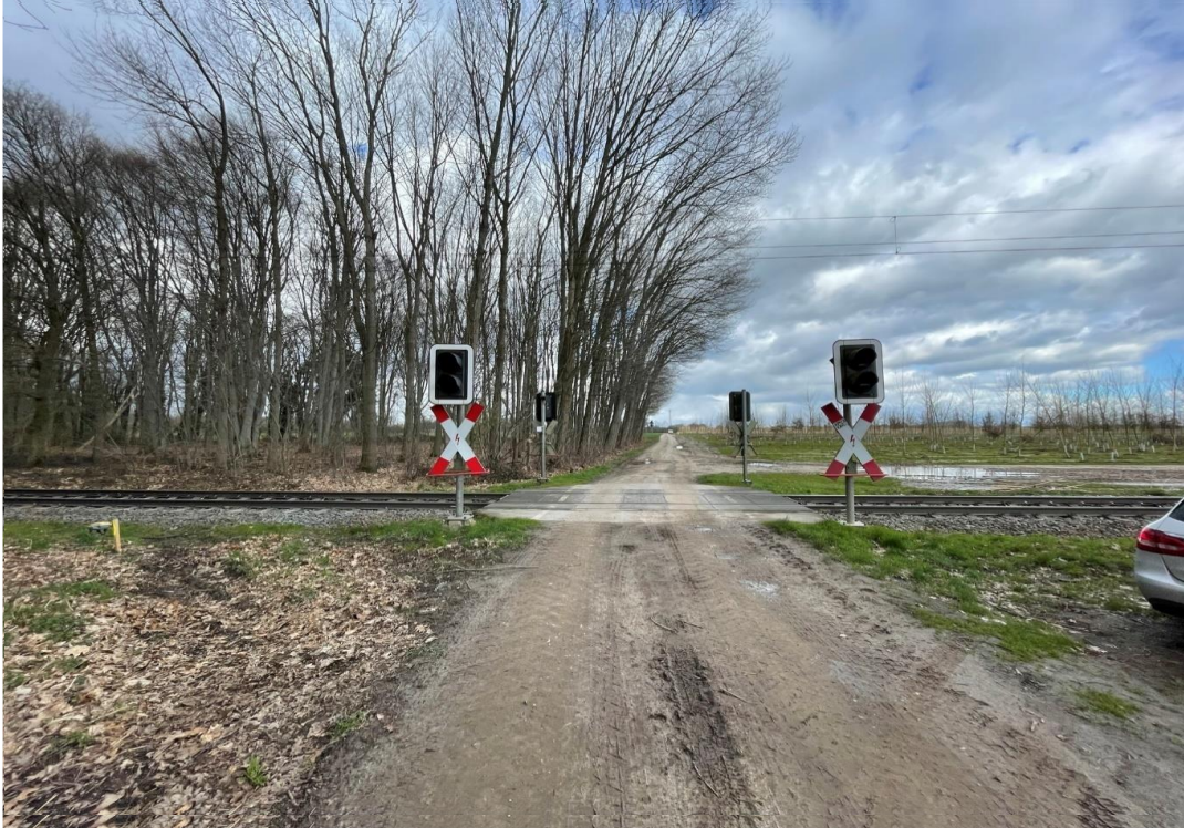
Abbildung 1: BÜ km 15,03 „Lenzenweg“, Strecke 2510, Stadt Nettetal Blick in Richtung Süden

Im Auftrag der DB Netz AG wurde eine Verkehrszählung am Bahnübergang km 15,030 „Lenzenweg“ in der Stadt Nettetal, auf der Strecke 2510 (Viersen - Kaldenkirchen) durchgeführt.