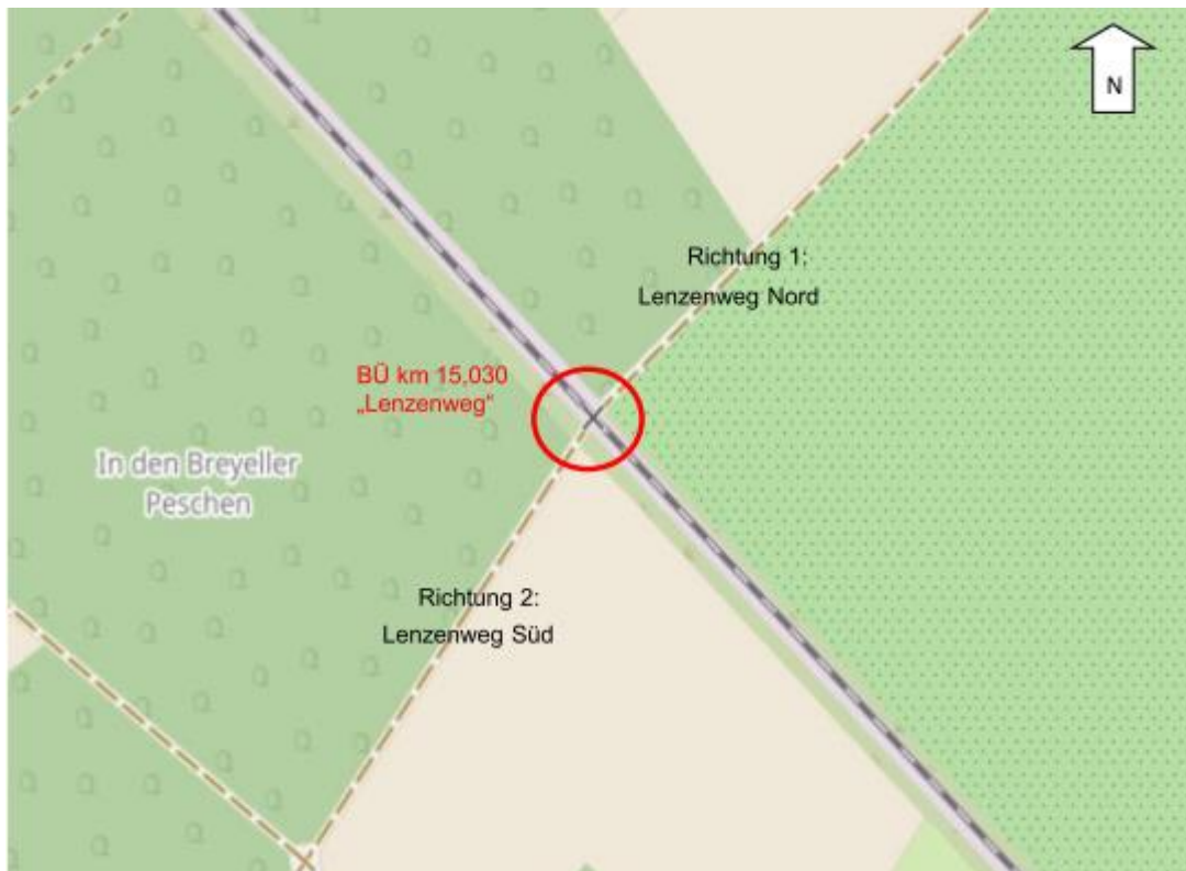
Abbildung 2: Übersicht Einmündungen am BÜ „Lenzenweg“ (Auszug OpenStreetMap 2023)