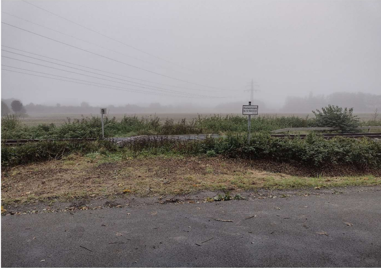
Abbildung 1: BÜ km 50,282 „Privater BÜ“, Strecke 1560, Stadt Vechta Blick in Richtung Westen

Im Auftrag der DB Netz AG wurde eine Verkehrszählung am Bahnübergang km 50,282 „Privater BÜ“ in der Stadt Vechta, auf der Strecke 1560 (Delmenhorst - Hesepe ) durchgeführt.